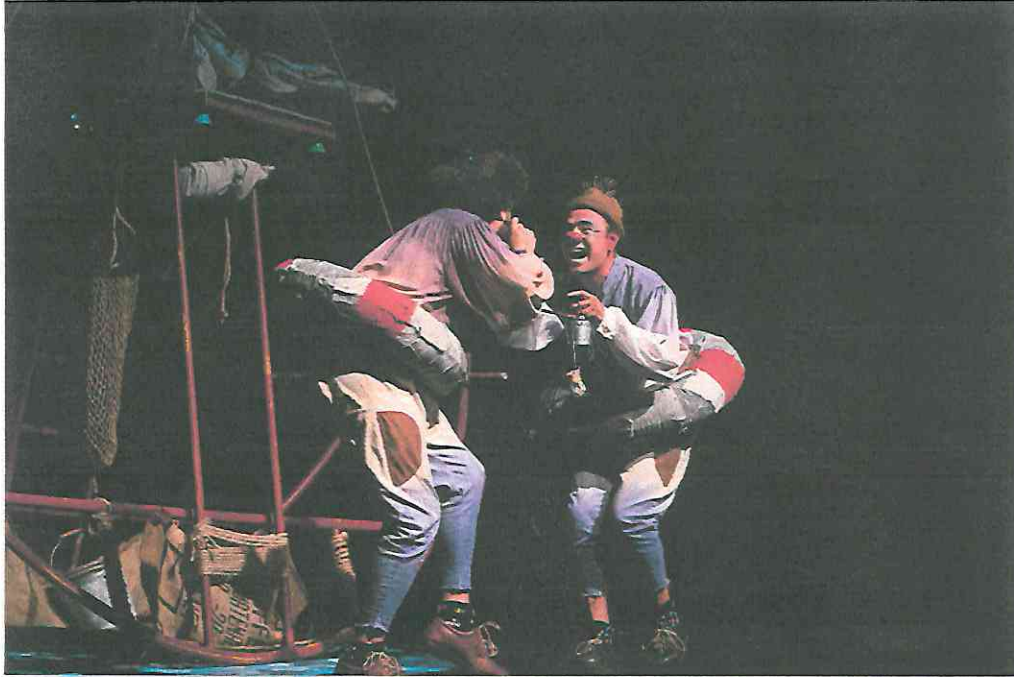
Fotografía 4 Primera función Escena previa a subir al barco.