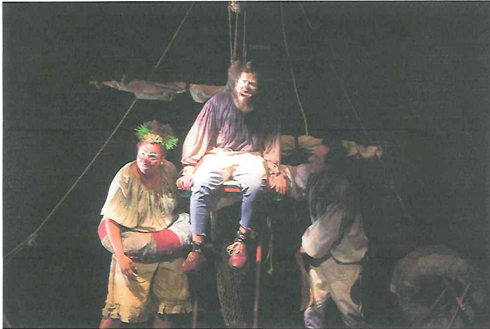
Fotografía 4 Segunda función Escena previa a la tormenta.