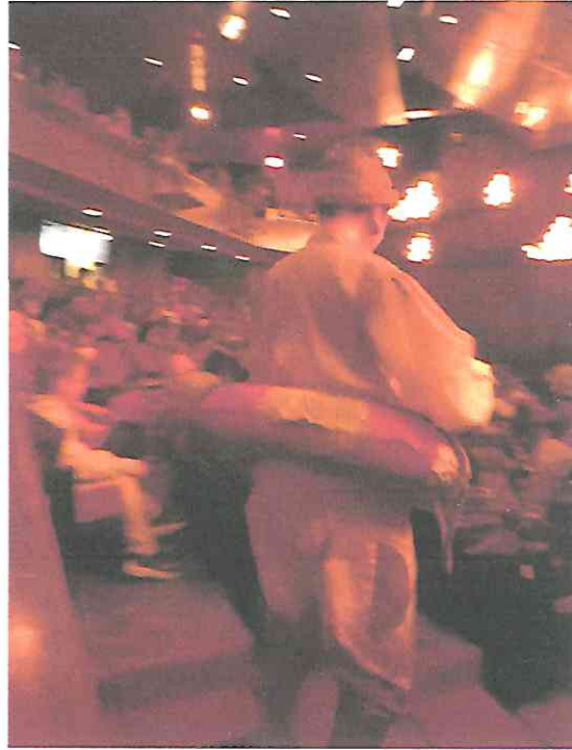
Fotografía 2 Segunda función Interacción con público, inicio de la obra.