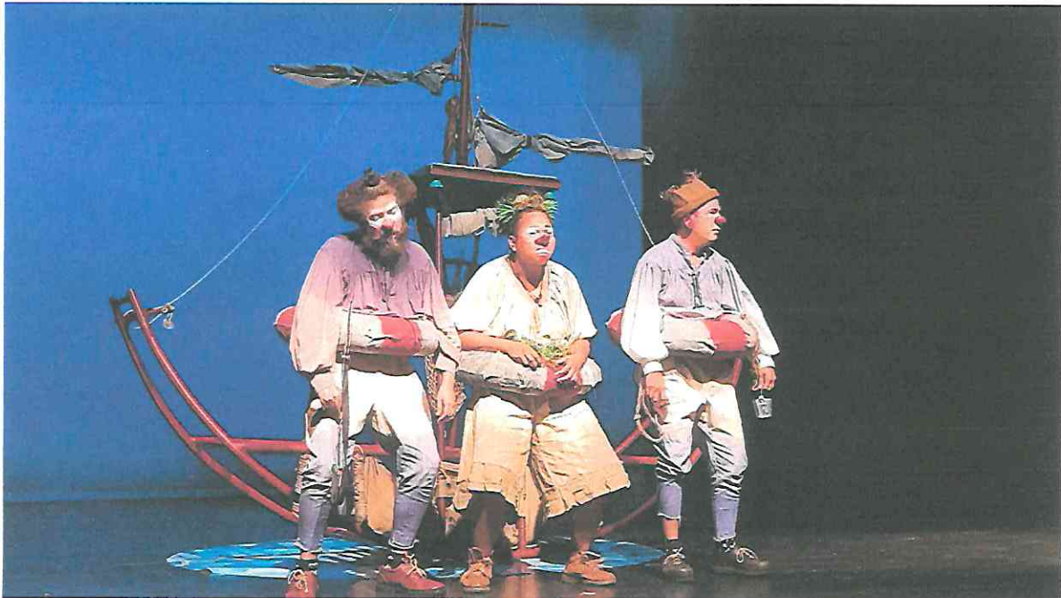
Fotografía 3 Segunda función Escena inicial, previo a subir al barco.