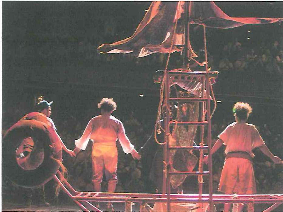
Fotografía 1 Segunda función Saludo al público en el cierre de la segunda función