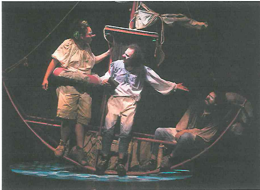
Fotografía 3 Primera función Escena de los personajes en el barco.