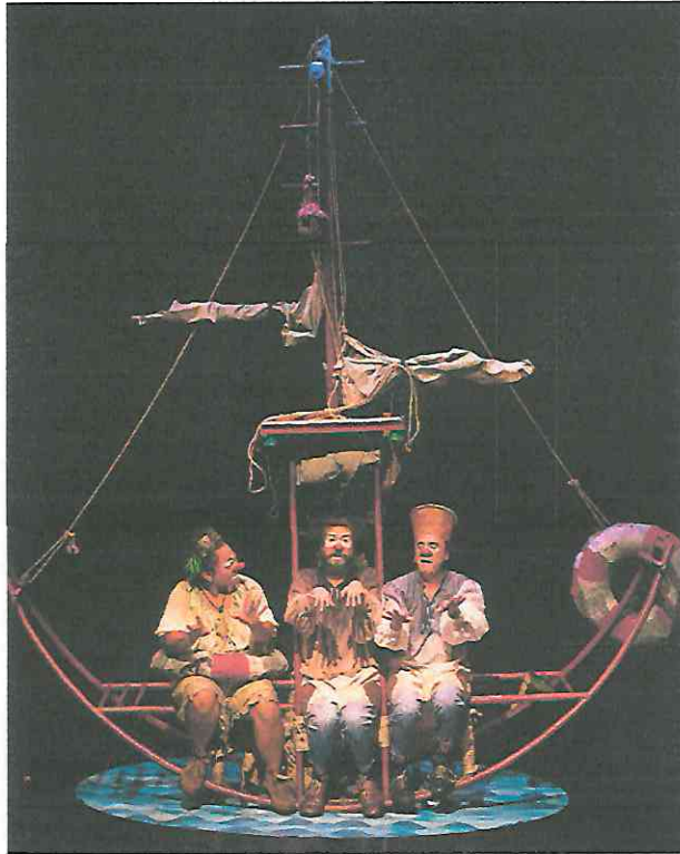
Fotografía 2 Primera función Escena de los personajes en el barco.