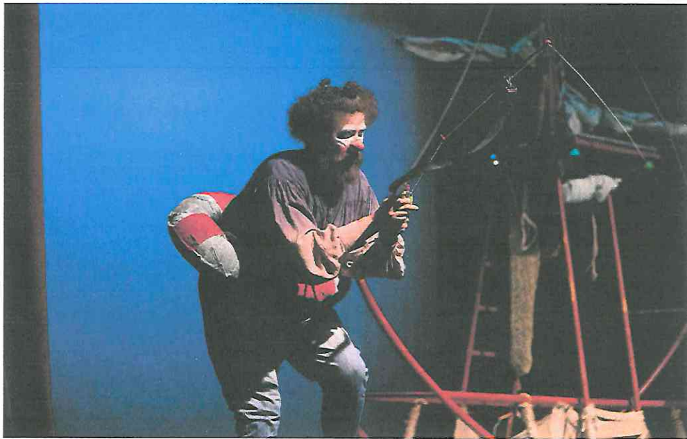
Fotografía 5 Primera función Interacción con público.