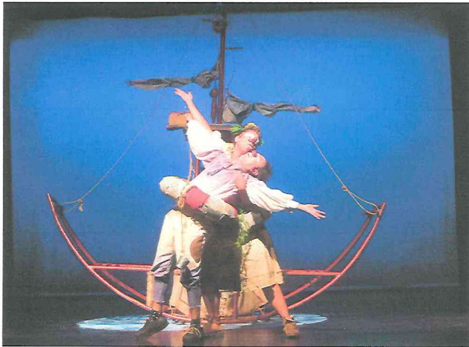
Fotografía 5 Segunda función Escena pesca.