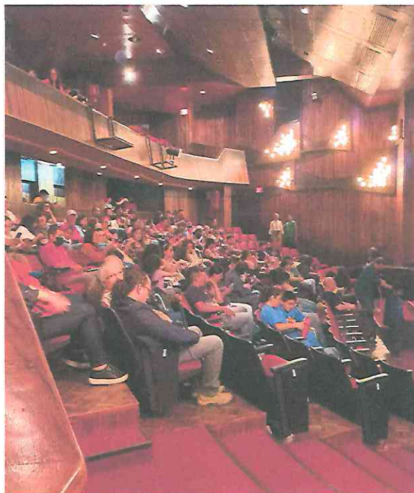
Fotografía 1 Primera función Público asistente.